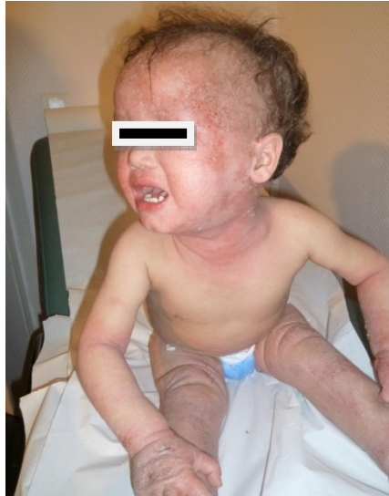
Fig.4 La DA qui va mal est une DA souvent négligée