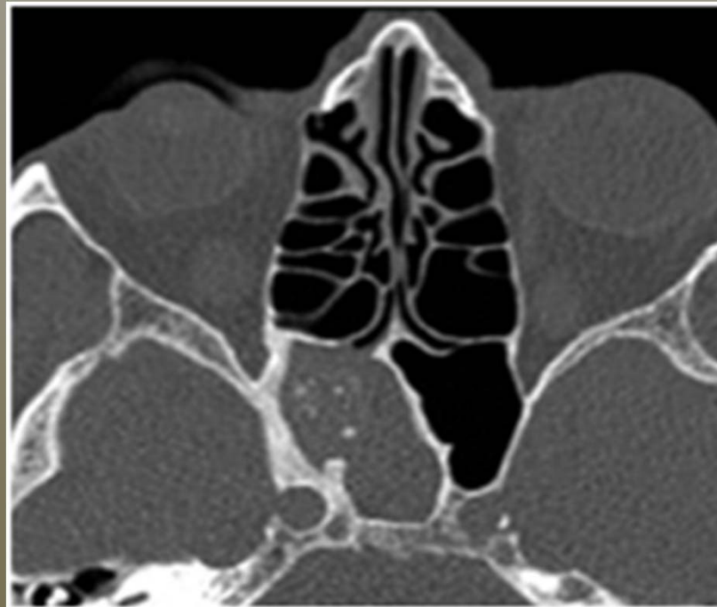
Figure 2. Sinusite sphénoïdale aspergillaire.